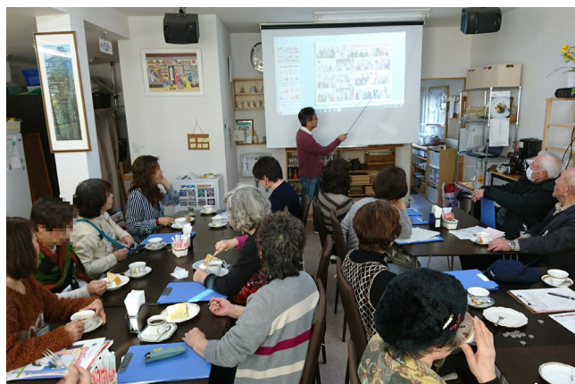
コミュニティサロンの見学会の様子