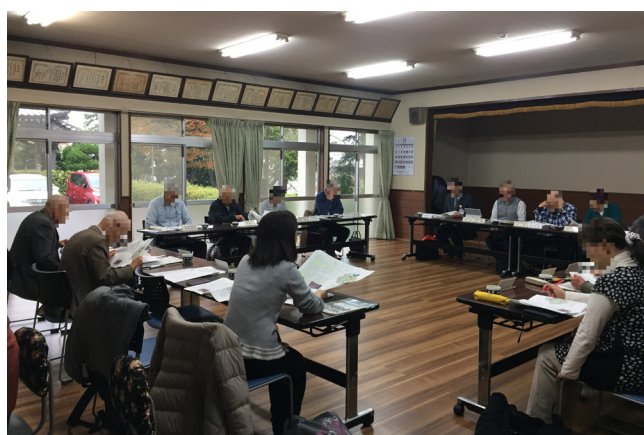
まちづくりのイメージ(会議・ワークショップの様子)