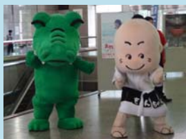
ワックんともんちゃん（輪島市門前町商工会）