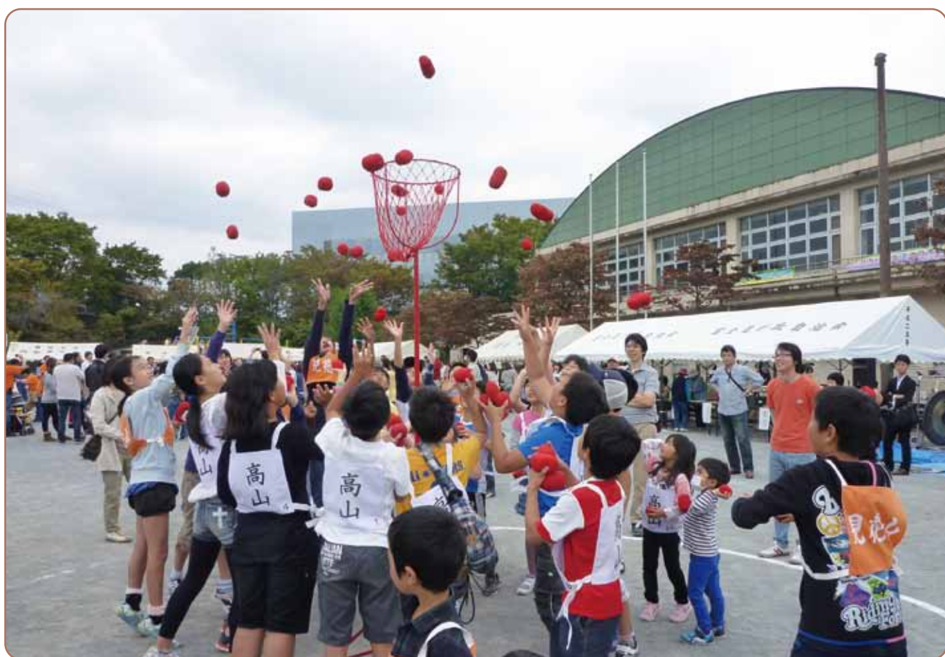
ふれあいの丘連合祭の様子