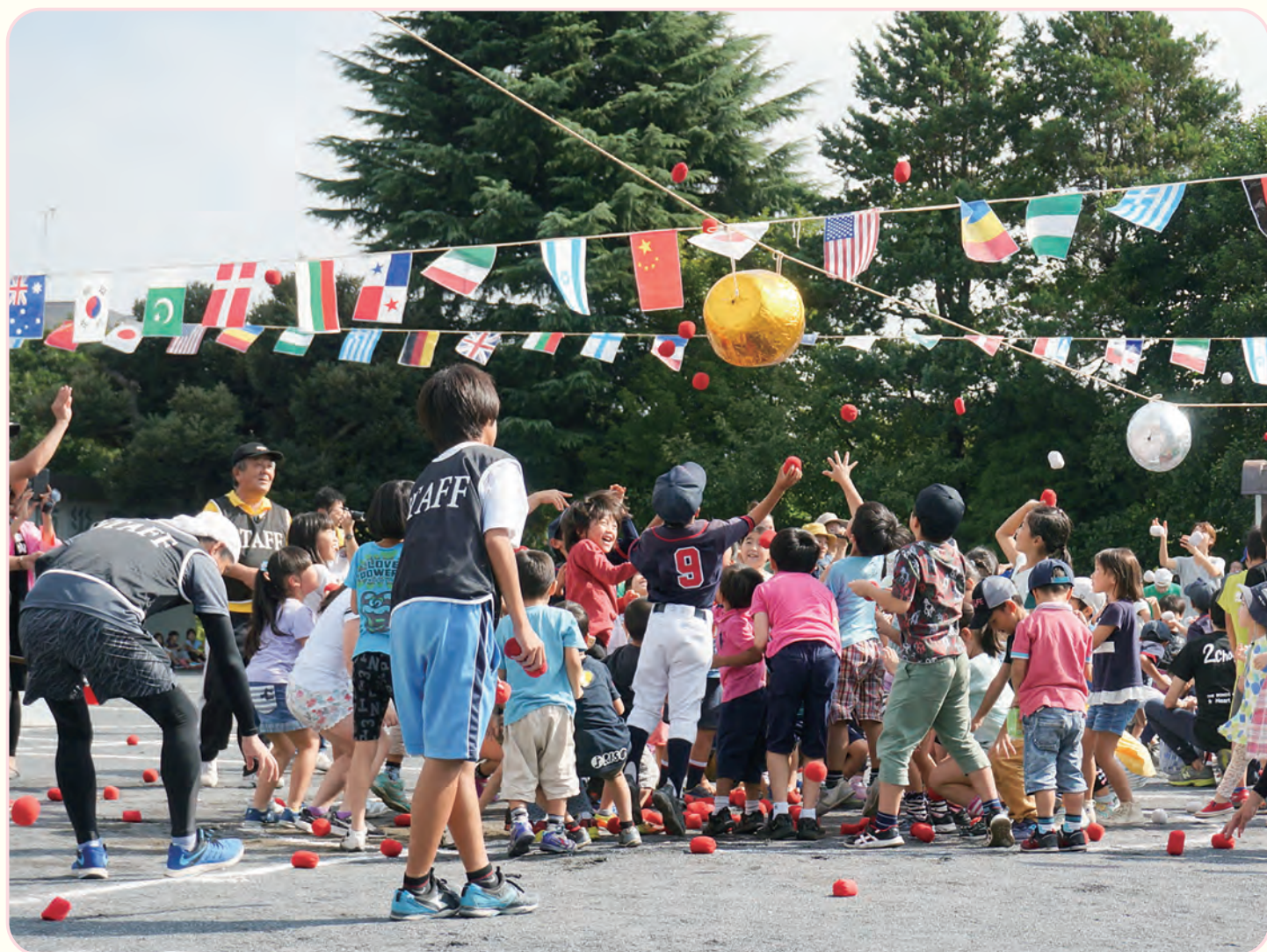
東山田連合町内会 親子運動会