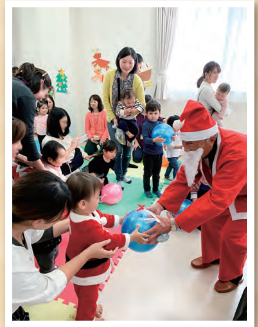
わいわい子育てサロン