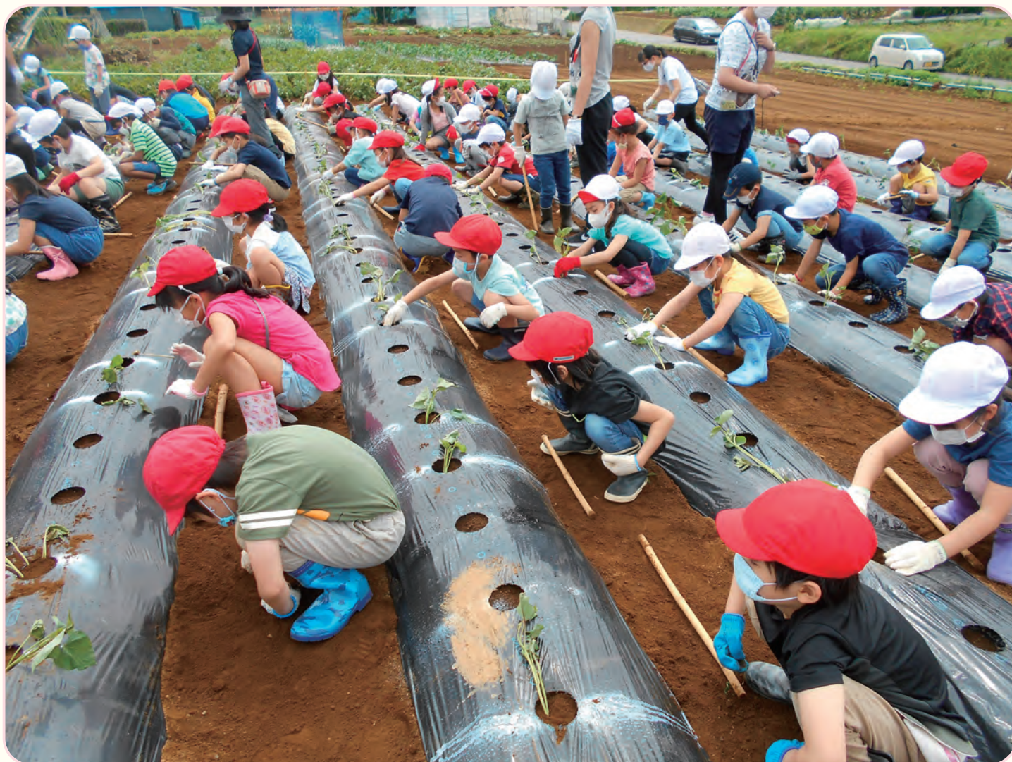
さつまいも 苗植え