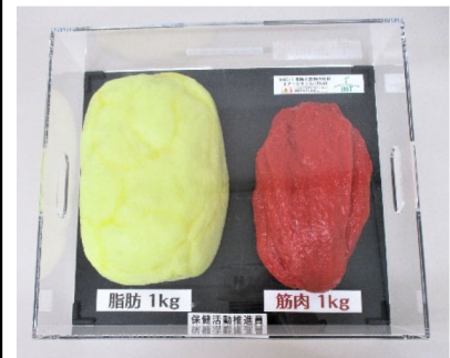
筋肉・脂肪模型 (各1kg)