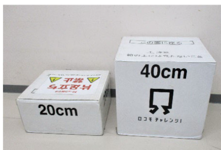
立ち上がりテスト台 (20cm・40cm)