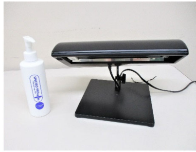
手洗いチェッカー