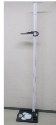
折り畳み式身長計