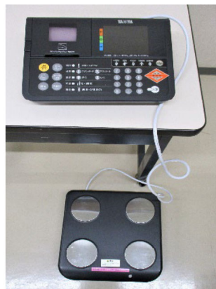
体組成計 (セパレート型)