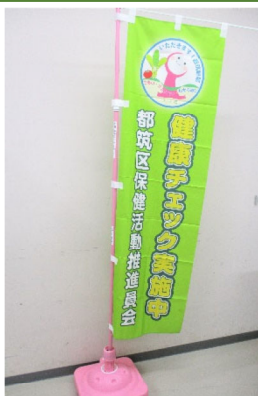
のぼり旗 (健康チェック実施中)